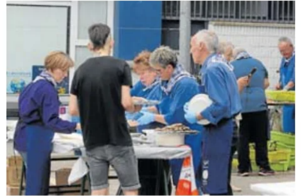
Voluntarios trabajan durante la degustación del Berdel Eguna. J.L.