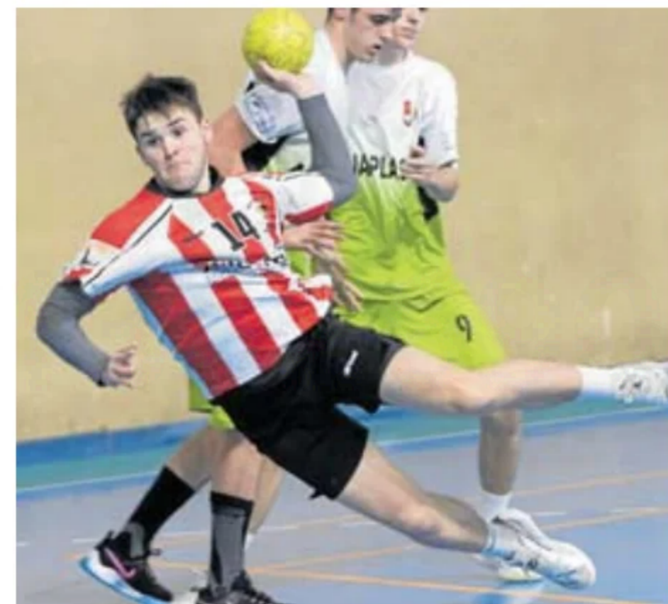
Un jugador del Alcorta se dispone a lanzar a portería. ASKASIBAR

Finalmente, el Pizzería Salento de categoría masculina jugará mañana (a las 18.00 horas) en el polideportivo municipal de Hernani su segundo partido de la Gipuzkoako Deba Kopa ante el potente Hernani Papelera Zikuñaga.