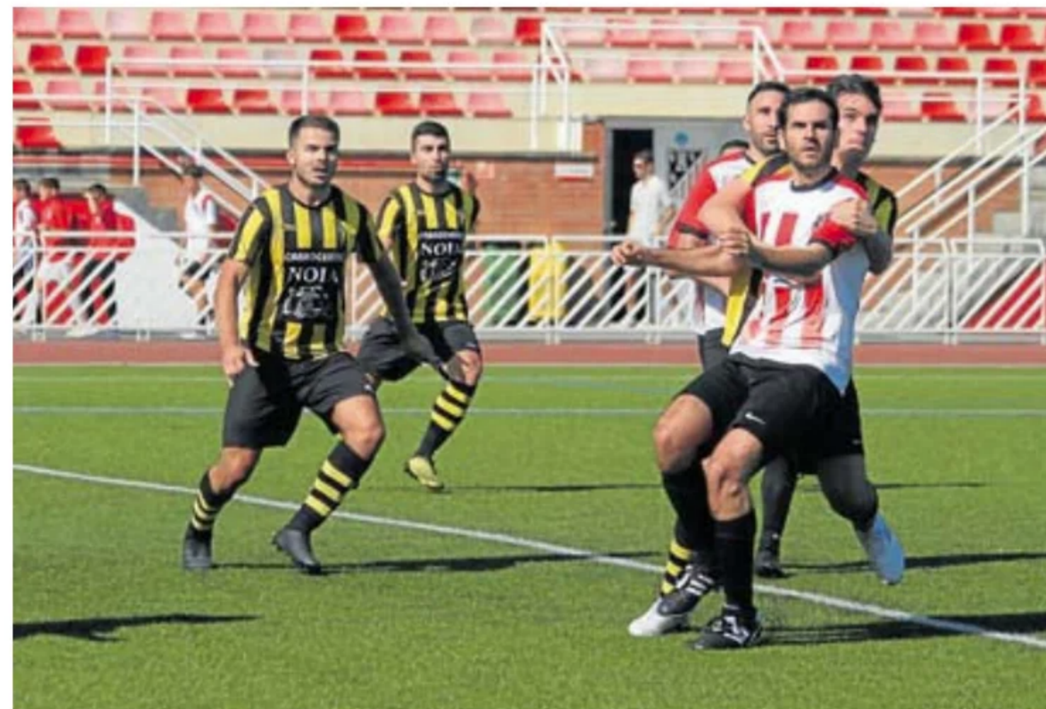
Jugadores del Haundi y del Amaikak Bat en un lance del derbi de la primera vuelta disputado en Mintxeta.

Por su parte, el Soraluze (10º con 33 puntos) jugará este próximo domingo en su feudo de Ezozia (a las 16.30 horas) ante un Zestoa (13º con 29 puntos) que a falta de tres jornadas para la conclusión del campeonato liguero todavía no tiene garantizada la permanencia.