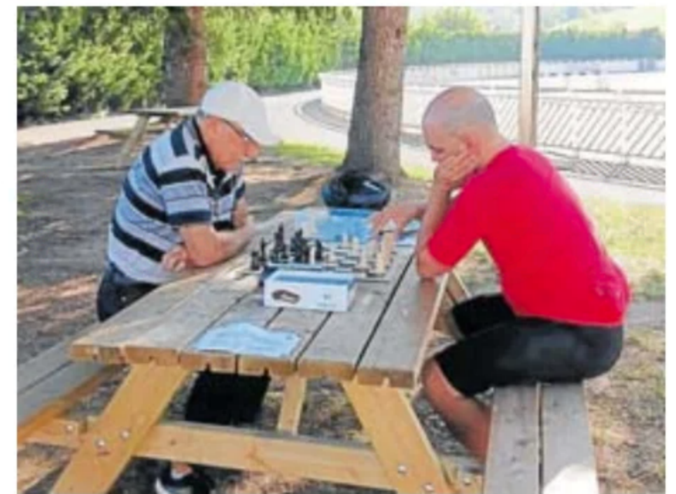
Dos aficionados juegan una partida de ajedrez en Mintxeta. ZUBI ONDO

Sea como fuere, las personas interesadas en participar en el I Torneo Berkoa Udaberri de ajedrez que arrancará el próximo lunes pueden apuntarse hasta las 14.00 horas del sábado enviando un mensaje a la dirección de correo electrónico udaberri-mintxeta1@gmail.com . La inscripción es gratuita.