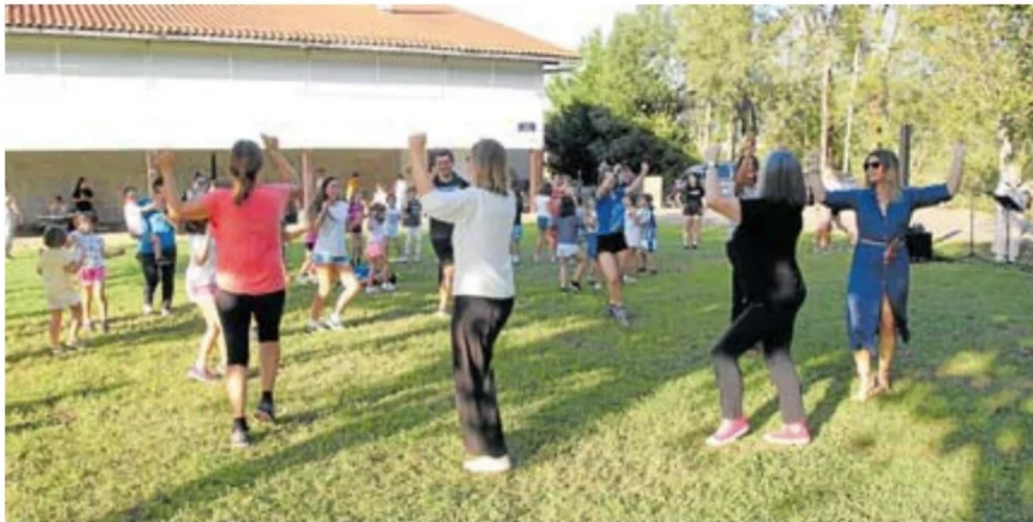
Un momento de la romería familiar que se celebró el pasado mes de octubre en la campa de Azkue.