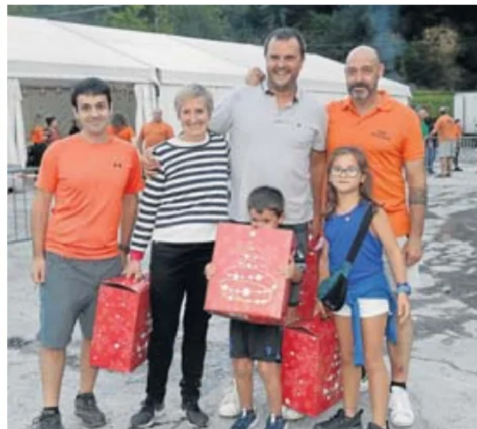
Organizadores de las fiestas de Arriaga posan antes de iniciarse los actos de ayer y junto a los ganadores de los concursos de lanzamiento de txapelas y huesos de oliva.