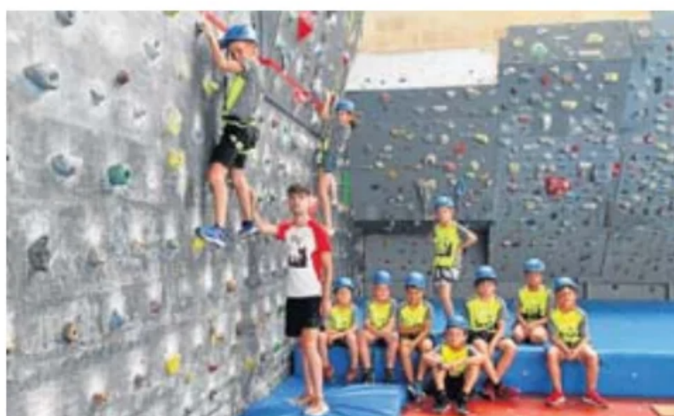
Varios menores en una clase de escalada, en el rocódromo. J. LEON

Aunque algunos de los citados cursillos han dado comienzo esta misma semana, desde el Patronato de Deportes subrayan que «todavía hay plazas en todas las